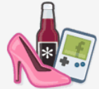
Marque ou produit